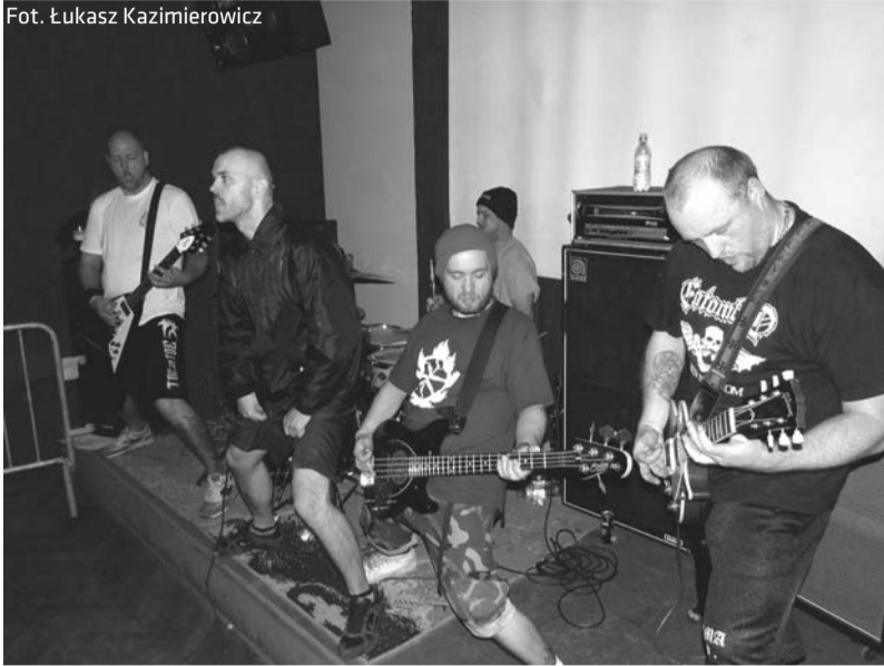
Mocne brzmienia zaserwowała publiczności m. in. grupa Schizma

Pierwsza edycja Festiwalu Muzycznego Gotta Go! za nami. W opinii organizatorów jak i licznie zgromadzonej w cieszyńskim klubie Panopticum publiczności, można mówić o sukcesie naszej inicjatywy. 24 września mogliśmy usłyszeć 5 zespołów prezentujących różne odmiany muzyki hard core'owej i metalowej.