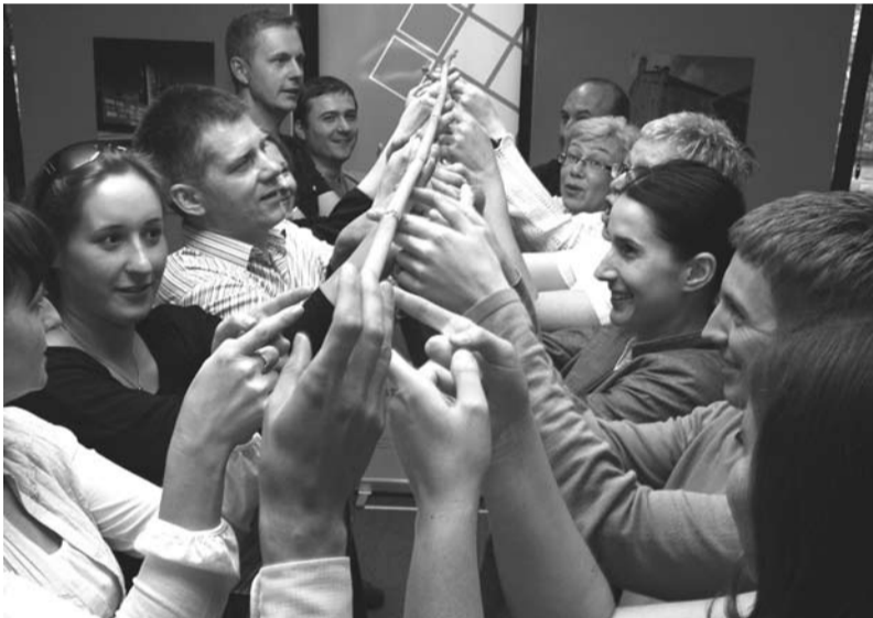
Spotkanie poświęcone zarządzaniu czasem będzie miało nietypową formę.