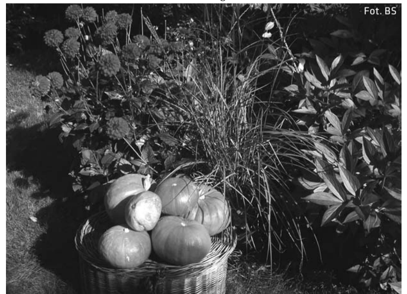
Okazałe dynie z ogrodu autorki artykułu

Autorka tekstu jest członkinią cieszyńskiego Towarzystwa Miłośników Ogrodnictwa