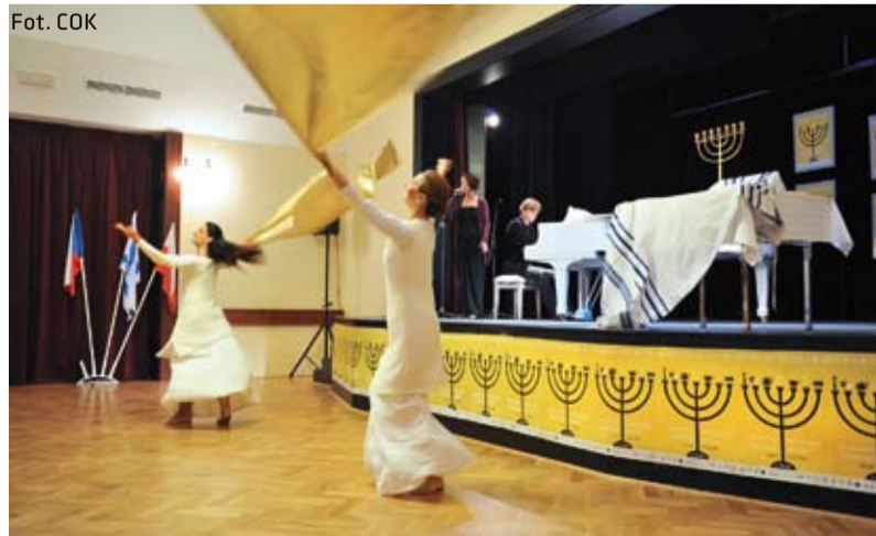
Pokaz tańca podczas inauguracji Dni Kultury Żydowskiej