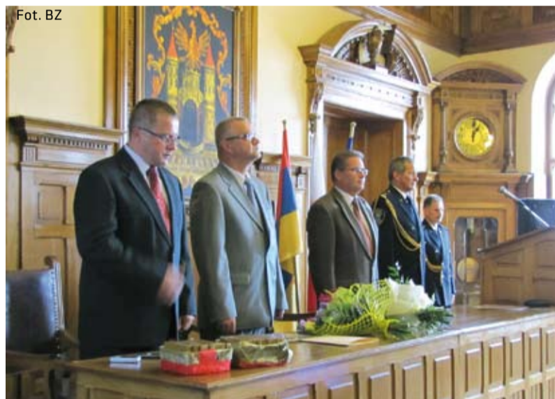
Z okazji jubileuszu Straży Miejskiej na sali sesyjnej w Ratuszu odbyła się uroczysta akademii