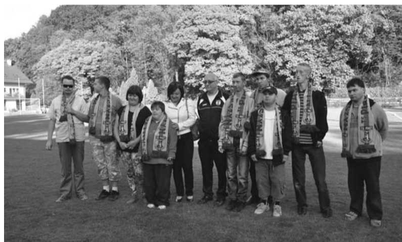
Członkowie Klubu Kibica po otrzymaniu szali

Dziękujemy wszystkim tym, którzy pomogli w organizacji meczu charytatywnego oraz uczestnikom, którzy przybyli na stadion.