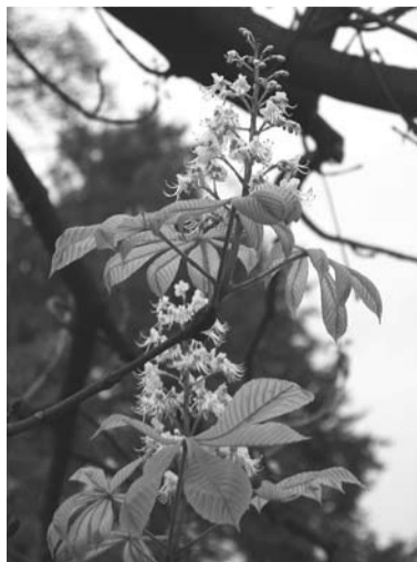
Kwitnące kasztany można zobaczyć w Lasku Miejskim