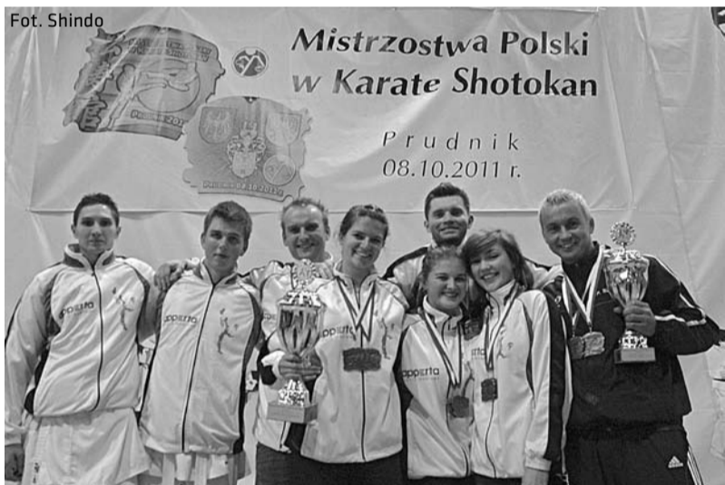
Nagrodzeni medalami zawodnicy z cieszyńskiego KS Shindo