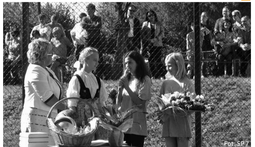
W uroczystości otwarcia boiska brali udział także uczniowie