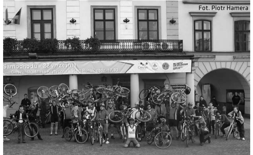
Pamiętkowe zdjęcie miłośników dwóch kółek podczas Dnia Bez Samochodu